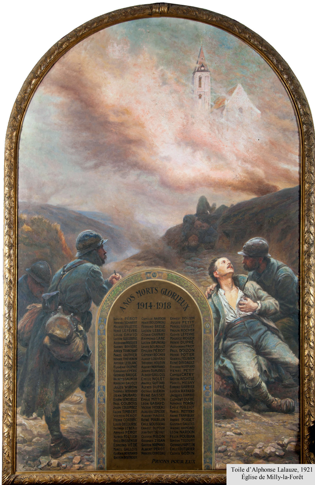
Toile d'Alphonse Lalauze, 1921 Église de Milly-la-Forêt