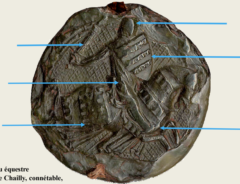
Doc.1 : Sceau équestre de Béraud de Chailly, connétable, 1305.