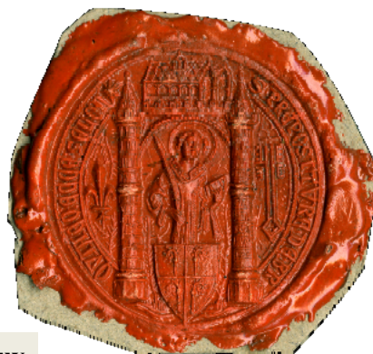
Sceau et matrice, Prévôté de Brouy, 15 e siècle. Arch. dép. Essonne